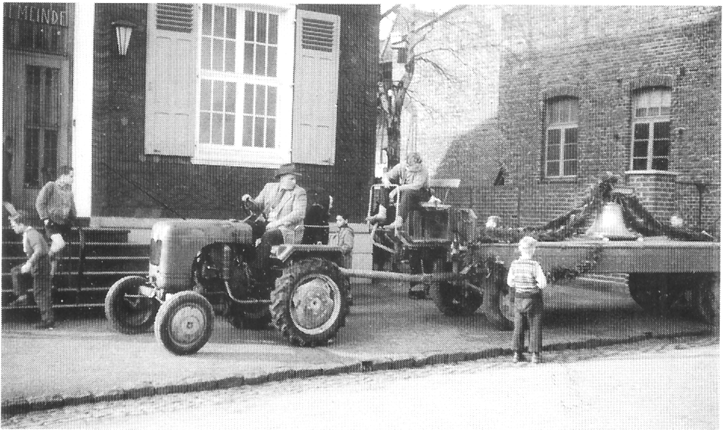
Anlieferung der Glocke