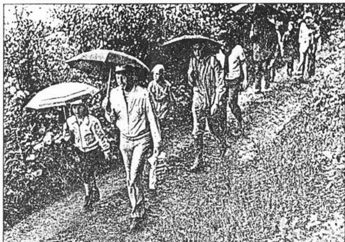
Ein verregneter Urlaub ist nicht schön, aber mit Regenschirm und Schutzkleidung sollte man das Beste daraus machen.